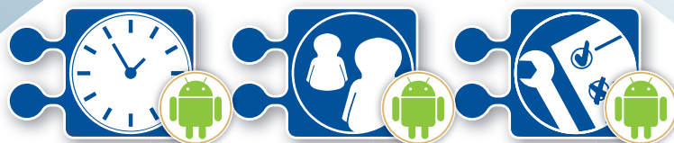
Mobile Zeiterfassung Mobiler Vertrieb|CRM Mobiler Kundendienst

UNSERE APP- & CLOUD-MODULE FÜR IHREN ARBEITSALLTAG: INTELLIGENT. INNOVATIV. INDIVIDUELL.