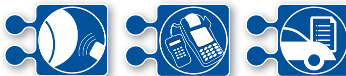
Stempeluhr POS Kassensoftware Werkstattsoftware